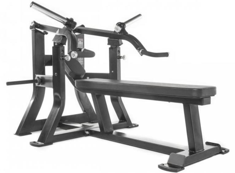
NYHET! PLATELOADED DUAL AXIS