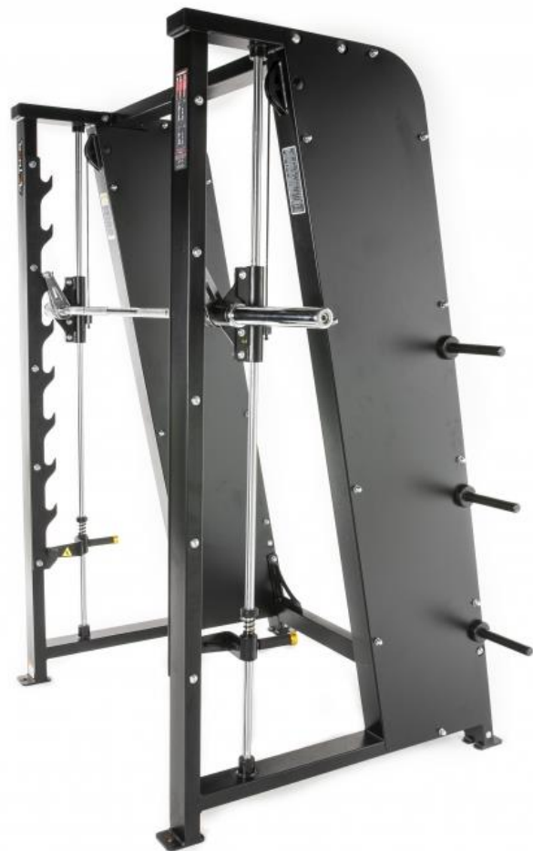
BYTE AV SMITHMASKIN