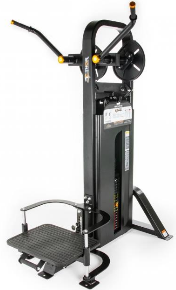
NYHET! STANDING VERTICAL PEC FLY