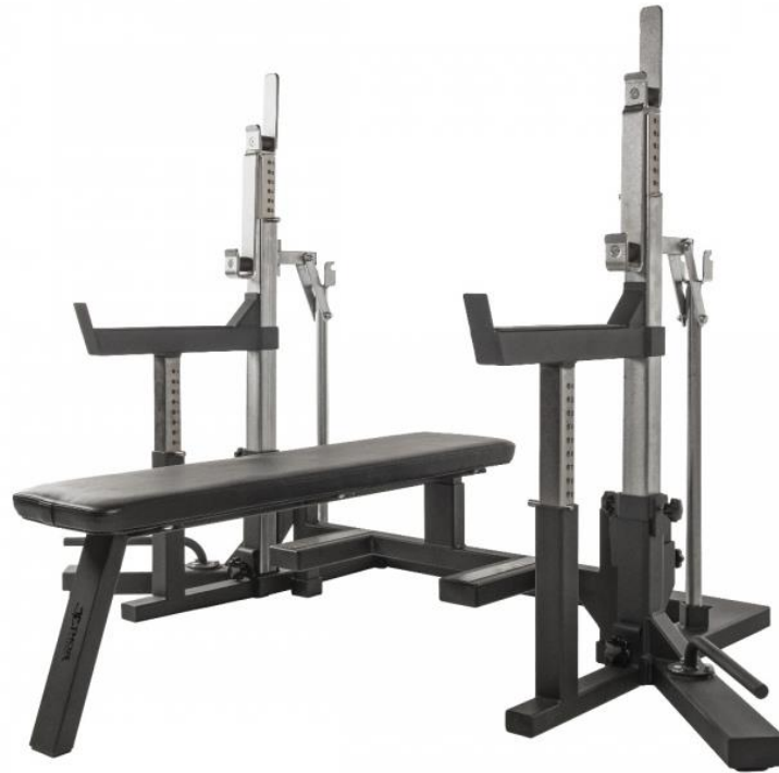
BÄNKPRESS – ERSÄTTER DEN VITA