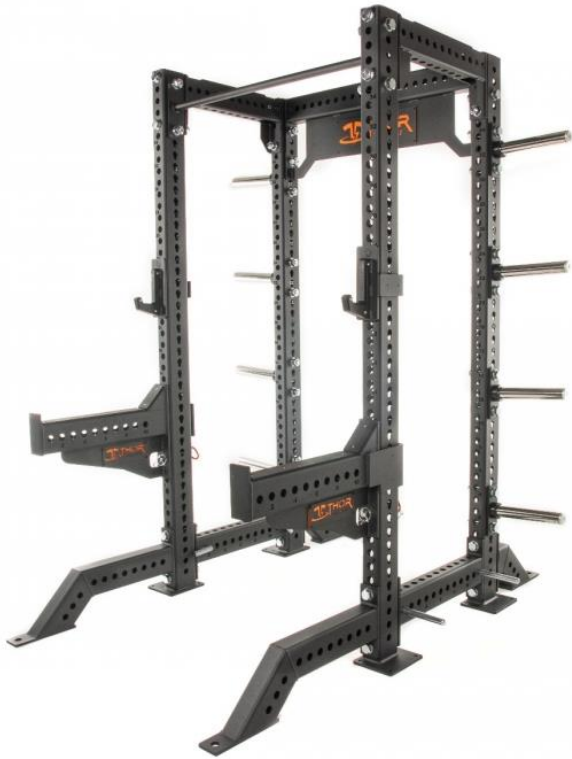
NYA HALFRACK PÅ FLAKET