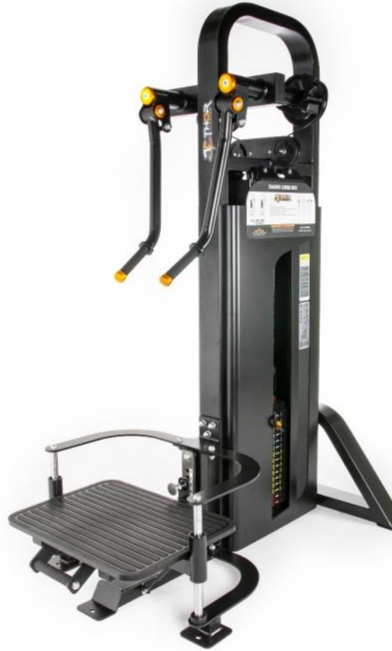
NYHET! STANDING LATERAL RAISE