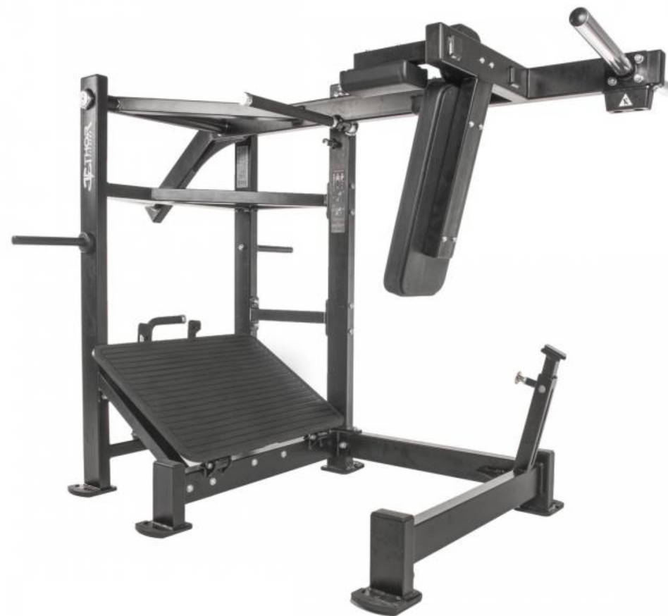
NYHET! PENDULUM SQUAT