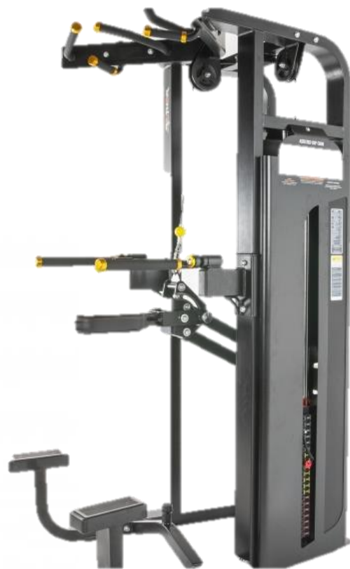
BYTE AV CHINS/DIP MASKIN