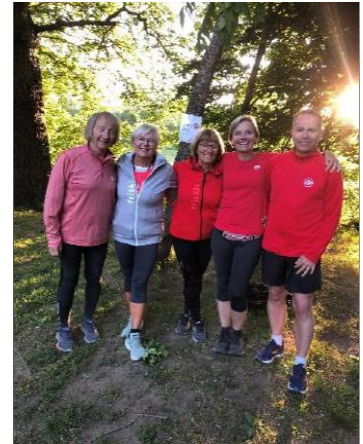
Några av våra ledare i Torup